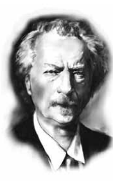
Ignacy Jan Paderewski 1860-1941