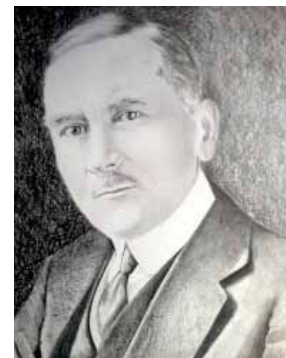
Roman Dmowski 1864-1939

Jednym z ważnych i odświętnych dni w życiu szkoły jest dzień 11 listopada. Właśnie w tym jesiennym dniu przed 96 laty ojczyzna nasza odzyska-