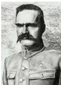
Józef Piłsudski 1867-1935