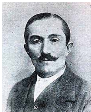
Wincenty Witos 1874-1945