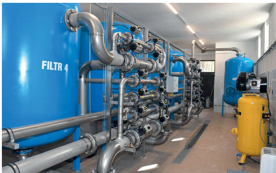
Nowa Stacja uzdatniania wody w Płaskiej

Nowe drogi asfaltowe pojawiają się w miejscach o szczególnie silnym natężeniu pojawiających się nowych nieruchomości i w związku z tym z potęgującymi się trudnościami komunikacyjnymi. Oczywiście ilość nowych dróg asfaltowych uzależniona jest od środków jakimi dysponuje Gmina Płaska na ich