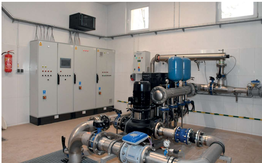
Zestaw pompowy na sieć wodociagową

Ogromnie ważną sprawą było rozpoczęcie w 2022 r. modernizacji a właściwie budowy na nowo trzech głównych Stacji Uzdatniania Wody (SUW) w Płaskiej, Serkim Lesie oraz w Gruszkach. W I etapie budowy Stacji Uzdatniania Wody, który został zakończony w marcu 2023 r., została całkowicie przebudowana SUW w Płaskiej. SUW w Płaskiej ma teraz zupełnie nowy system dostarczania wody z dwóch studni (jedna została wywiercona jako nowa), który przebiega przez nowy technolo-